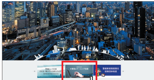
こちらのバナーをクリック

受講を希望又は検討される場合は、当協会のホームページを検索するか、右記の二次元コードからアクセスして「 全警協 eラーニング始動 」のバナーをクリックし、資料請求を行って関係書類を入手してください。（※お申込みは公安委員会の認定を受けた警備業者のみとなります）